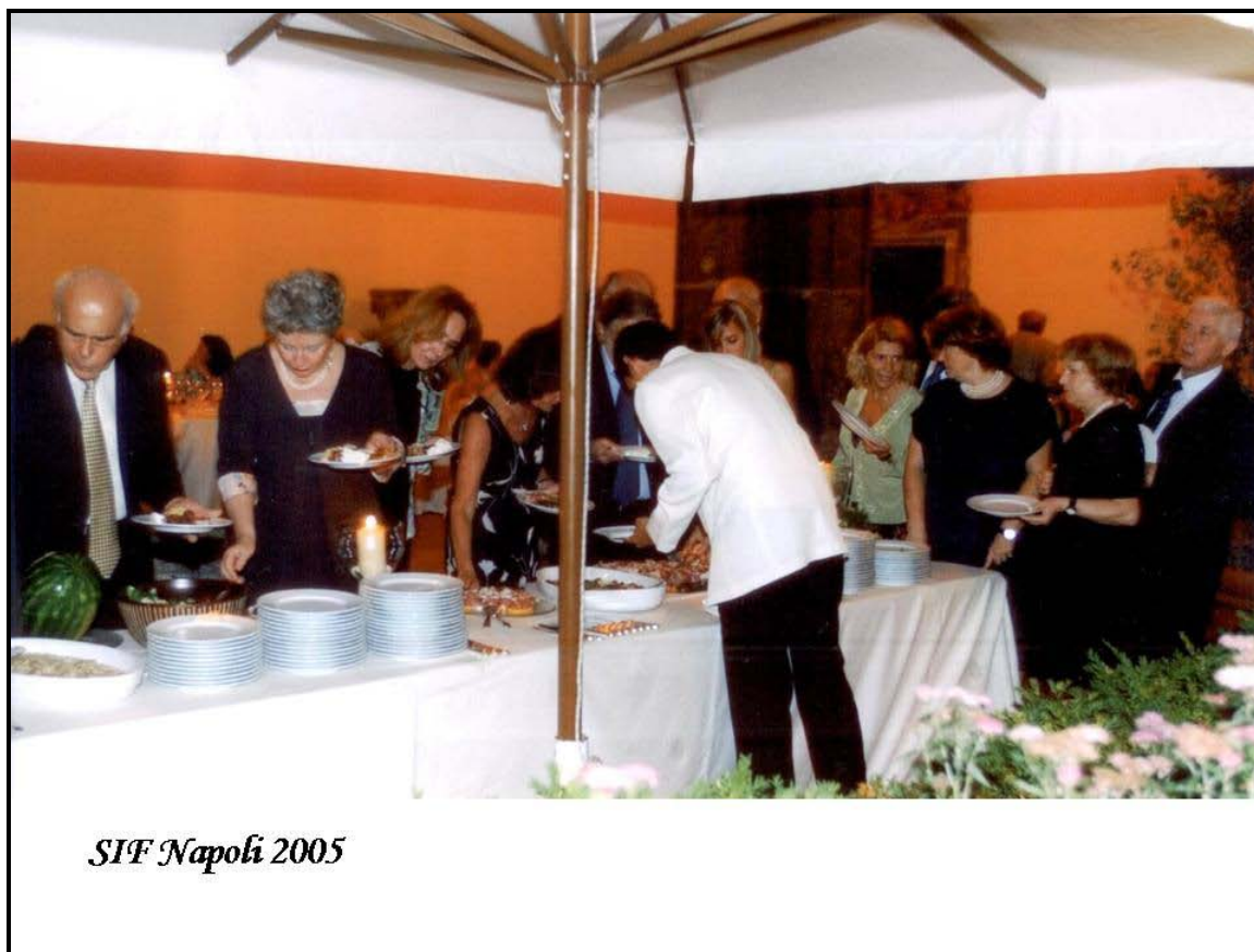
Momento di convivialità - 32° Congresso Nazionale della SIF (Napoli, 1-4 Giugno 2005)